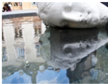
© Michel Ogier - « Fontaine Parmiggiani »

Stage ludique du patrimoine, animé par des guides conférenciers, agréés par le ministère de la Culture, mode d'emploi :